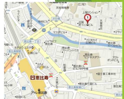
1階が郵便局のビルです